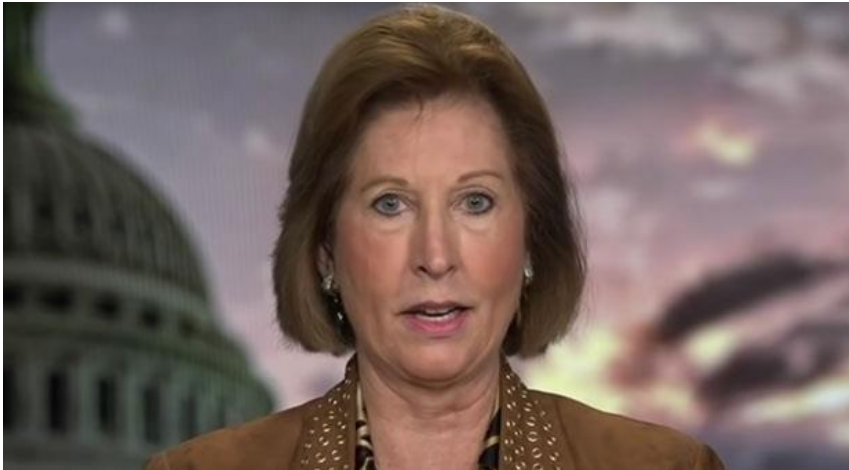
トランプ陣営の弁護士 Sidney Powell は「選挙結果を覆す」爆弾的証拠を持っていると証言

ドナルド・トランプの弁護士シドニー・パウエルは、非常に決定的であるので、「多数の州で」大統領選挙の「結果を覆す」ことのできる証拠を、彼女のチームは持っていると言った。